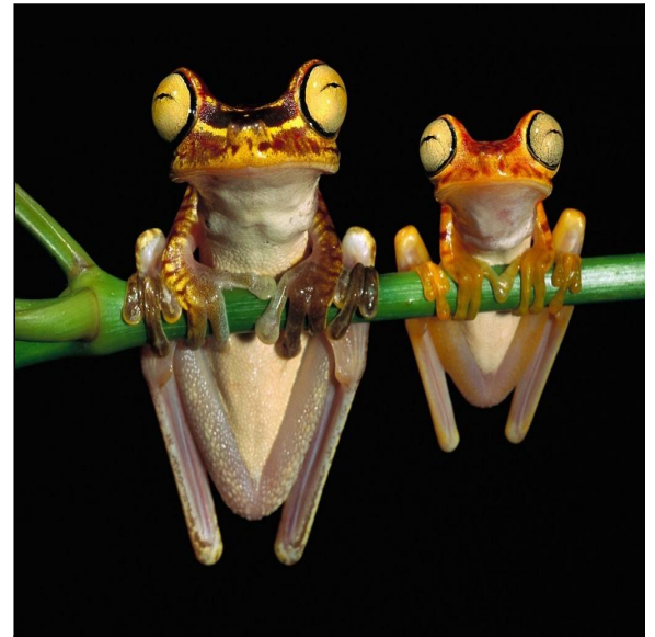
Madre e hija en su habitat natural

Un total de 4.000 viven en el Bronx, donde los científicos de la sociedad para la conservación de la vida silvestre y el zoo de Toledo, los mantienen con vida con la esperanza de que, de algún modo, regresen a la naturaleza, y a ese estado de libertad deseada.